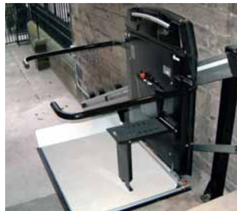
HL7 avec strapontin