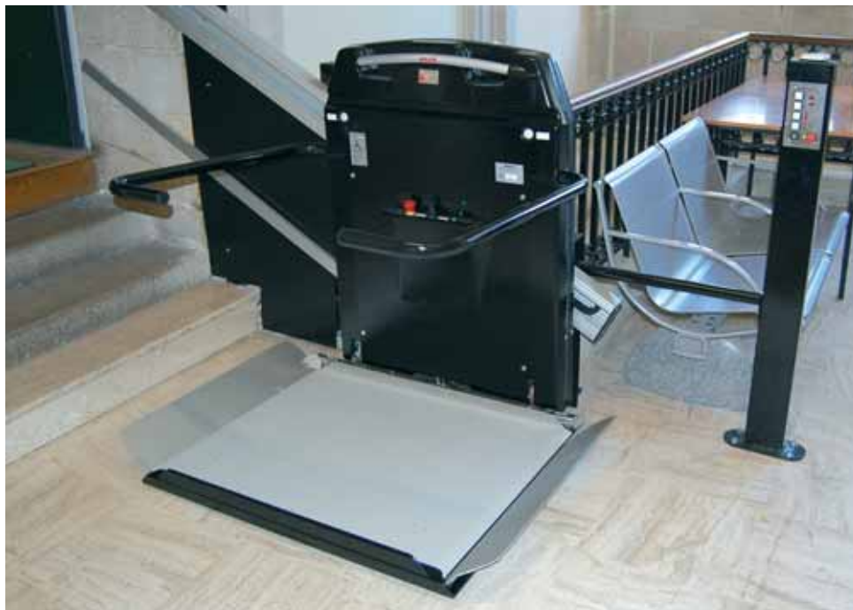
Une intégration parfaite dans un immeuble administratif classé Monument Historique. HL7

Appréciez le savoir-faire scandinave. Pour transporter une personne sur son fauteuil roulant en hauteur et dans un escalier, l'expérience d'un constructeur et la maîtrise de son métier sont des valeurs sûres.